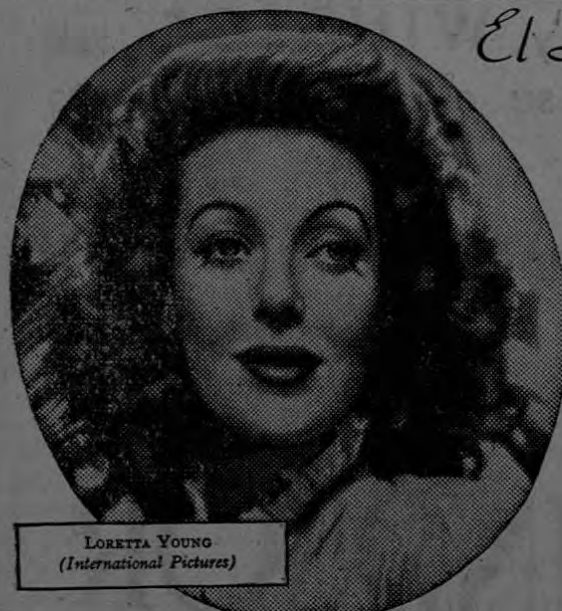
LORETTA YOUNG (International Pictures)

El Secreto de Belleza de las Estrellas del Cine